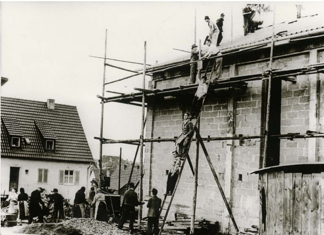
Abbildung 16: Helferinnen und Helfer beteiligen sich an der Errichtung der Christus-König-Kirche, 1954