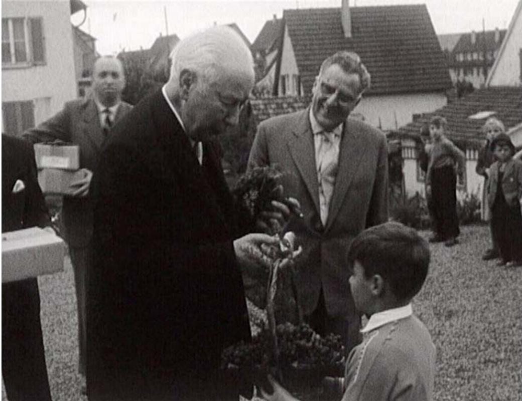
Abbildung 4 und 5: Bundespräsident Theodor Heuss besucht am 24. September 1957 die Theodor-Heuss-Siedlung in Brackenheim