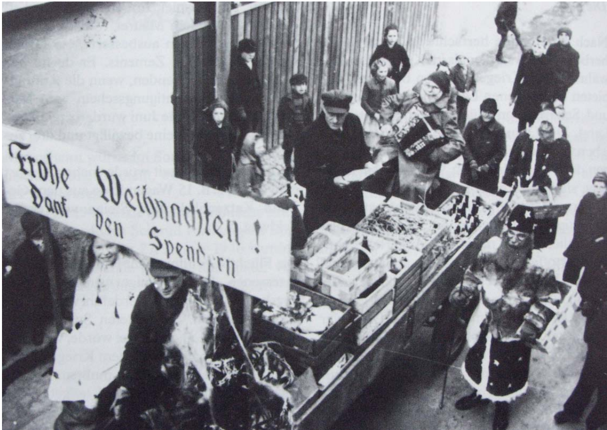
Abbildung 6: Meimsheimer Spendenverteilung an Heiligabend 1948