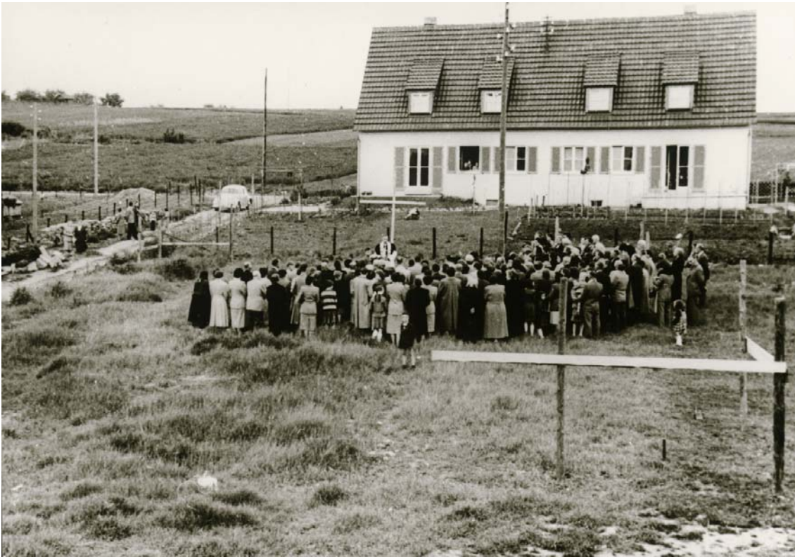
Abbildung 15: Die Grundsteinlegung der Christus-König-Kirche in der Theodor-Heuss-Siedlung am 13. Juni 1954